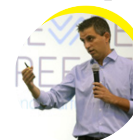
Christos Dimas , Deputy Minister for Development & Investments, Member of the Hellenic Parliament for Corinthia