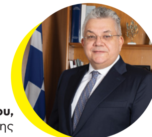
Καθηγητής Νικόλαος Γ. Παπαϊωάννου , Πρύτανης Αριστοτέλειου Πανεπιστημίου Θεσσαλονίκης