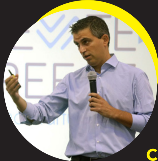
Christos Dimas, Deputy Minister for Development & Investments, Member of the Hellenic Parliament for Corinthia