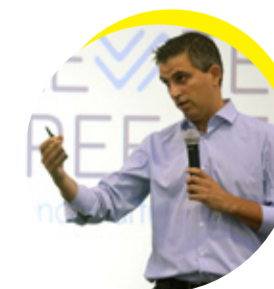
Christos Dimas , Deputy Minister for Development & Investments, Member of the Hellenic Parliament for Corinthia