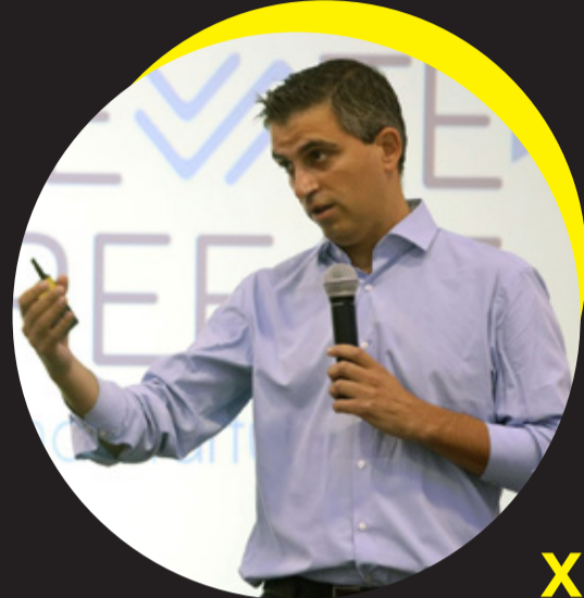
Χρίστος Δήμας, Υφυπουργός Ανάπτυξης & Επενδύσεων, Βουλευτής Κορινθίας